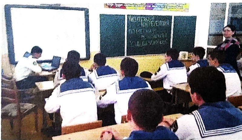
Просмотр фрагмента фильма по мотивам произведения «Судьба человека».