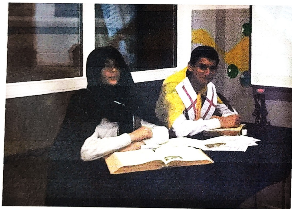
Фрагмент из инсценировки о создателях кириллицы Кирилле и Мефодии.