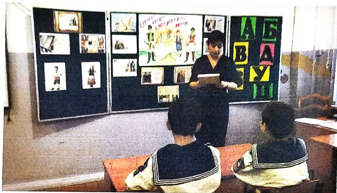
Краткая историческая справка о Дне славянской письменности.