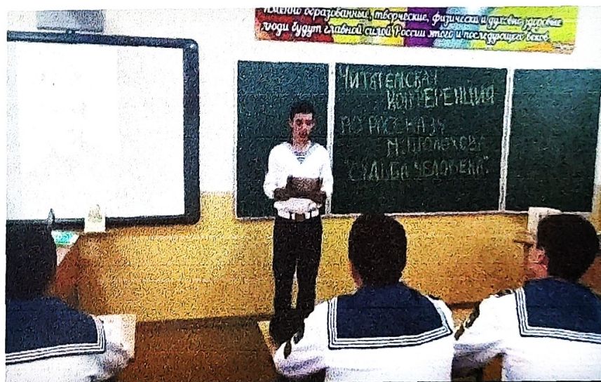
Краткие сведения о М. Шолохове.